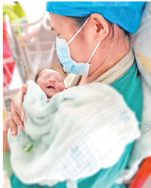
“巴掌宝宝”在新生儿科医护人员24小时精心守护下,各项生命体征平稳。

本报讯 2025年6月6日上午,广州中医药大学梅州医院(梅州市中医医院,梅州市田家炳医院)新生儿科有一位胎龄28+2周出生,体重仅有950克“巴掌宝宝”在父母的陪伴下出院了。那天对于这个小宝宝及父母、新生儿科医护人员都是个特殊的日子,经过新生儿科医护人员与家属共同努力,出院时小宝宝体重已达到2210克,各项生命体征平稳。