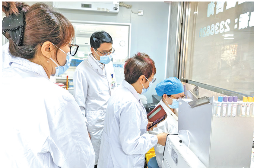
专家组在对医学检验科进行现场监督评审。